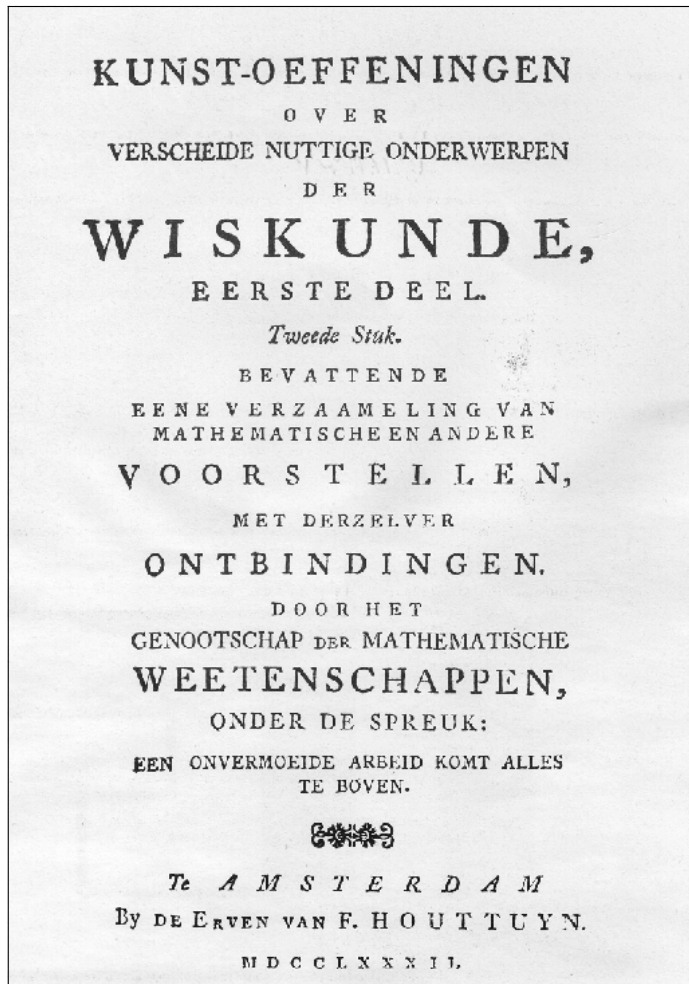
Titelblad van de eerste uitgave van het Wiskundig Genootschap

“Reeds in het eerste verslag eener algemeene Vergadering dat bewaard is gebleven, vindt men gewag gemaakt van ‘plaats gehad hebbende